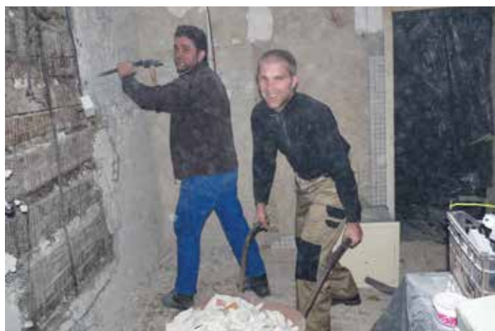
Během práce na rekonstrukci interiéru chaty na Prašivé