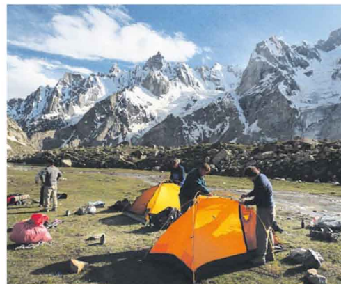
V PÁKISTÁNU. Výškový tábor v Karakoram.