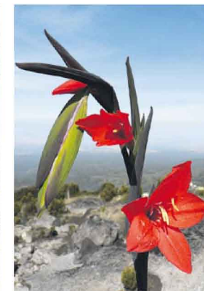
V KENI. Flóra na úpatí Mt. Kenyí.