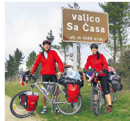
NA SARDINII. Stillerovi v průsmyku Valico sa Casa. 6x foto archiv Martina Stillera