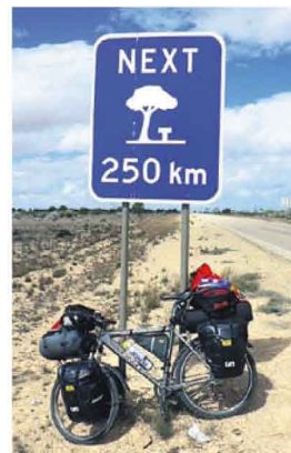
PAUZA. Momentka z cesty Austrálií.